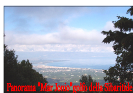
Panorama "Mar Jonico" dalla Sibaritide

Attrezzatura di base per l'escursioni: zaino tecnico, bastoncini, scarponi in buono stato, borraccia, giacca a vento, mantellina per la pioggia, cappello, creme solare, maglione in pile, si suggerisce un abbigliamento di base leggero, perché può fare molto caldo in caso di bel tempo. Sul percorso si trova acqua di sorgente (a meno di siccità improvvisa).